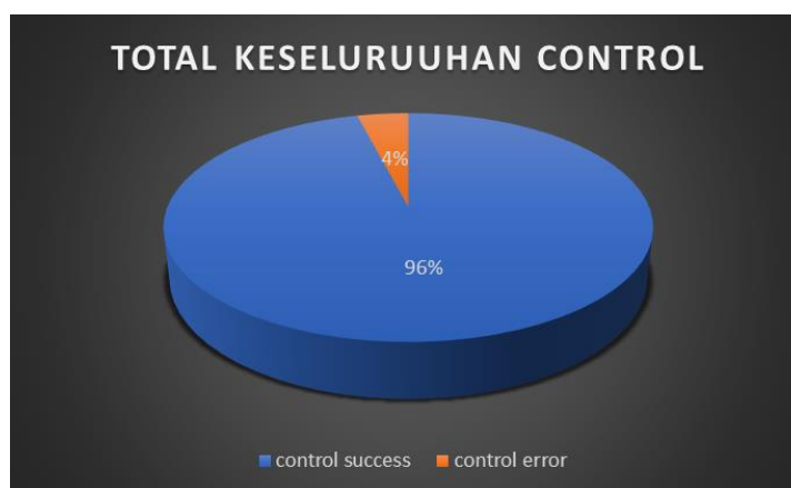
Gambar 3. Total keseluruhan control

Total keseluruhan aktivitas teknik control yang dilakukan pada 11 pertandingan liga futsal profesional 2022 adalah: total control sebanyak 3.546 kali dengan uraian control Success sebanyak 3.402 kali (96%) dan control error sebanyak 144 kali (4%). Rata-rata control yang dilakukan pada tiap pertandingan sebanyak 322 kali dengan uraian control success sebanyak 309 kali dan control error sebanyak 13 kali.