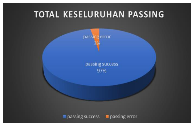
Gambar 1. keseluruhan passing

Total keseluruhan aktivitas teknik passing yang dilakukan pada 11 pertandingan liga futsal profesional 2022 adalah: total passing sebanyak 4.246 kali dengan uraian passing Success sebanyak 3.945 kali (93%) dan passing error sebanyak 301 kali (7 %). Rata-rata passing yang dilakukan pada tiap pertandingan sebanyak 386 kali dengan uraian passing Success sebanyak 359 kali dan passing error sebanyak 27 kali.