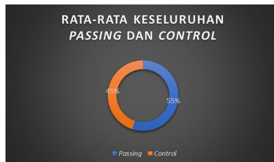
Gambar 5. Diagram Rata-rata Aktivitas Passing dan Control

Dari gambar diagram 4 dapat dikatakan bahwa teknik Control yang dilakukan pada pertandingan Liga Futsal Profesional 2021/2022 Tim dari Bintang Timur Surabaya yang lebih sering dilakukan ialah Teknik control direction control sebesar 1.470 kali dalam 11 pertandingan terakhir atau sebesar 34,67%, dan Teknik control yang jarang dilakukan ialah Teknik control and turning sebanyak 498 kali atau sebesar 11,75%. Hasil perhitungan rata-rata teknik dasar. passing dan control pada 11 pertandingan tim Bintang Timur Surabaya Liga Futsal Profesional 2021/2022 secara keseluruhan dapat digambarkan pada diagram 5