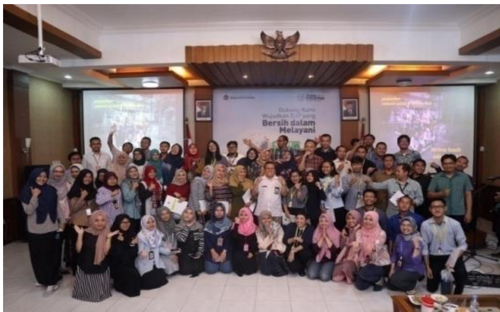
Gambar 7. Foto Penutupan Pendampingan WPOP

Penutupan dilakukan pada tanggal 4 April 2019 di KPP Solo dengan meriah oleh Kepala KPP Solo.