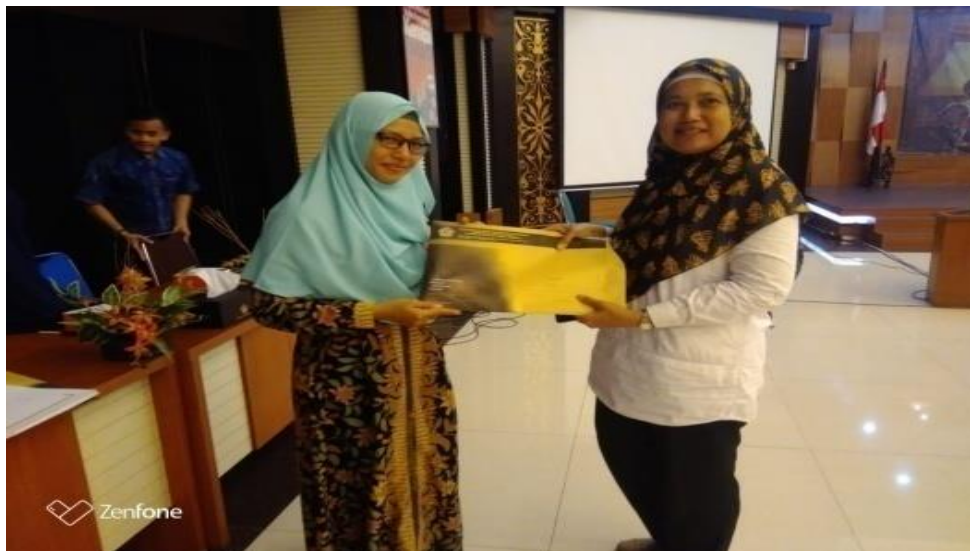
Gambar 4. Penyerahan hasil tes kepada Tax Center (Tim Pengabdian)

Tugas tim pengabdian selanjutnya adalah melakukan penilaian dan menentukan hasilnya. Hasil penilaian diserahkan kepada DJP Kanwil Jateng II