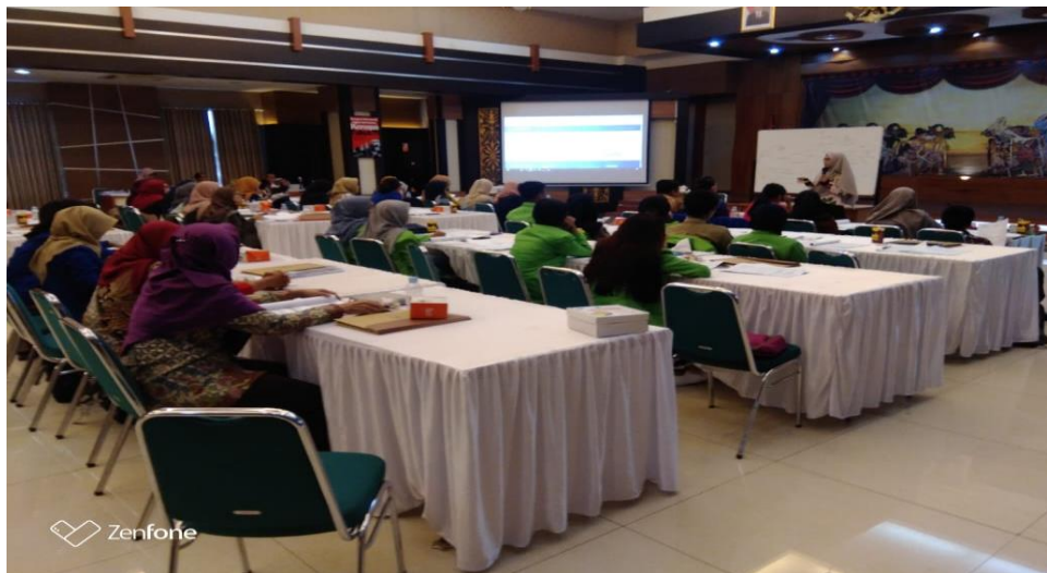
Gambar 4. Kegiatan Pelatihan Hari Pertama