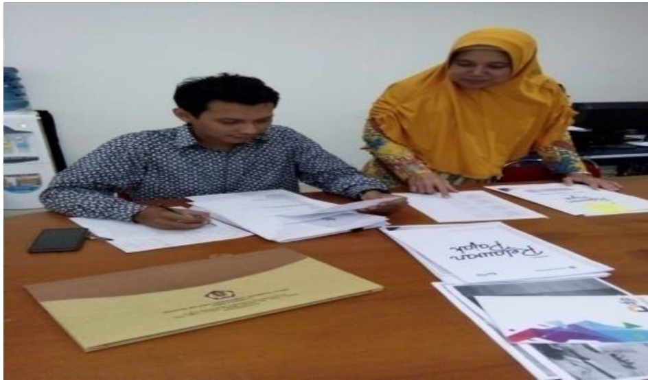
Gambar 5. Penilaian oleh Tim